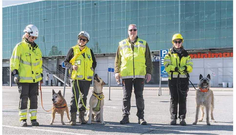
Aamupäivällä ulkoalueella esiintyivät Hämeen Pelastusliitto ry:n pelastuskoirat. Koiriin pääsi tutustumaan myös sisätiloissa.