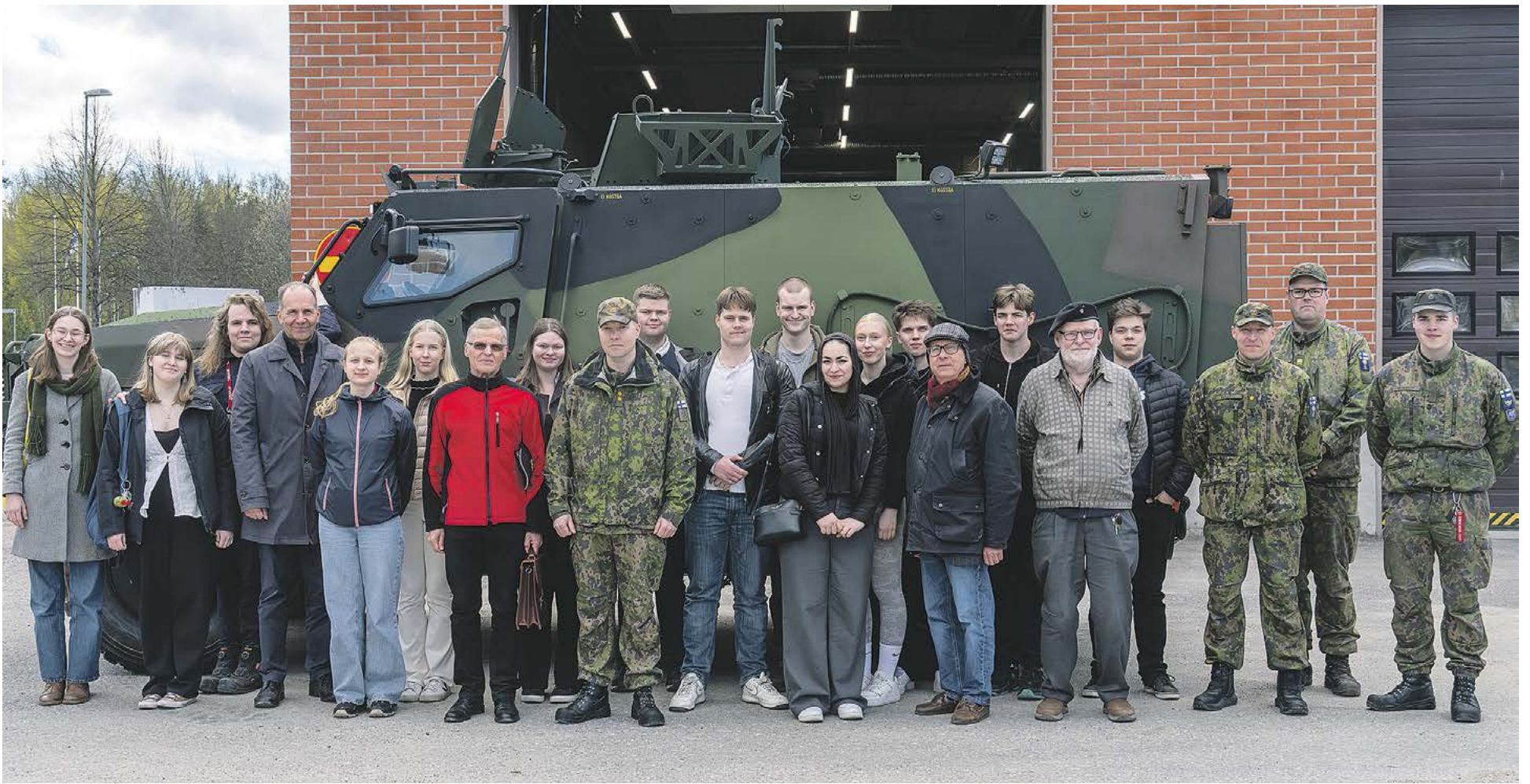
Ryhmäkuva vierailijoista ja varuskunnan puolesta vierailun isäntänä toimineista otettiin Sisu GTP 4X4 ajoneuvon vieressä.