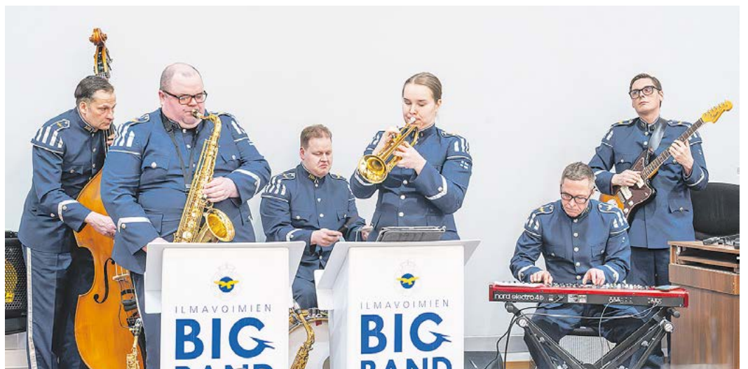
Ilmavoimien soittokunta esitti maanpuolustusjuhlassa myös kappaleet Väliaikainen (Matti Jurva), Rukous (Axel von Kothén), Pieni polku (Pentti Viherluoto) ja Lapin äidin kehtolaulu (Kalervo Hämäläinen).