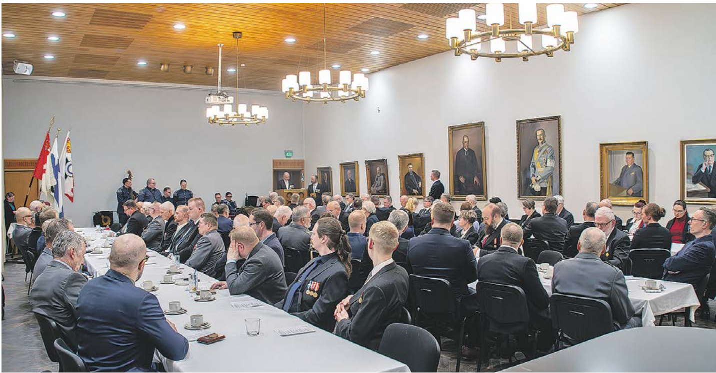
Suomalaisen Klubin Marskin sali täyttyi juhlavieraista.