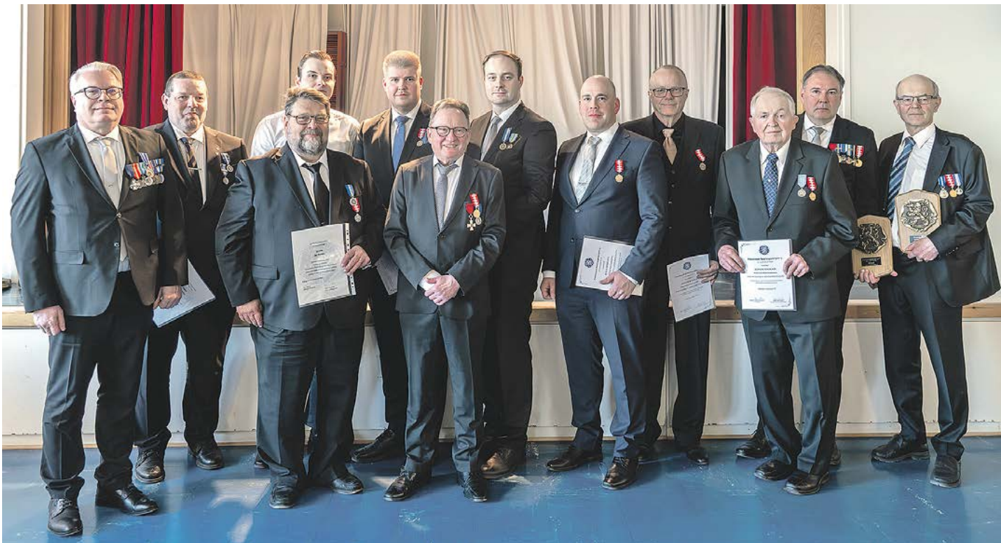
Juhlassa palkitut ryhmäkuvassa.