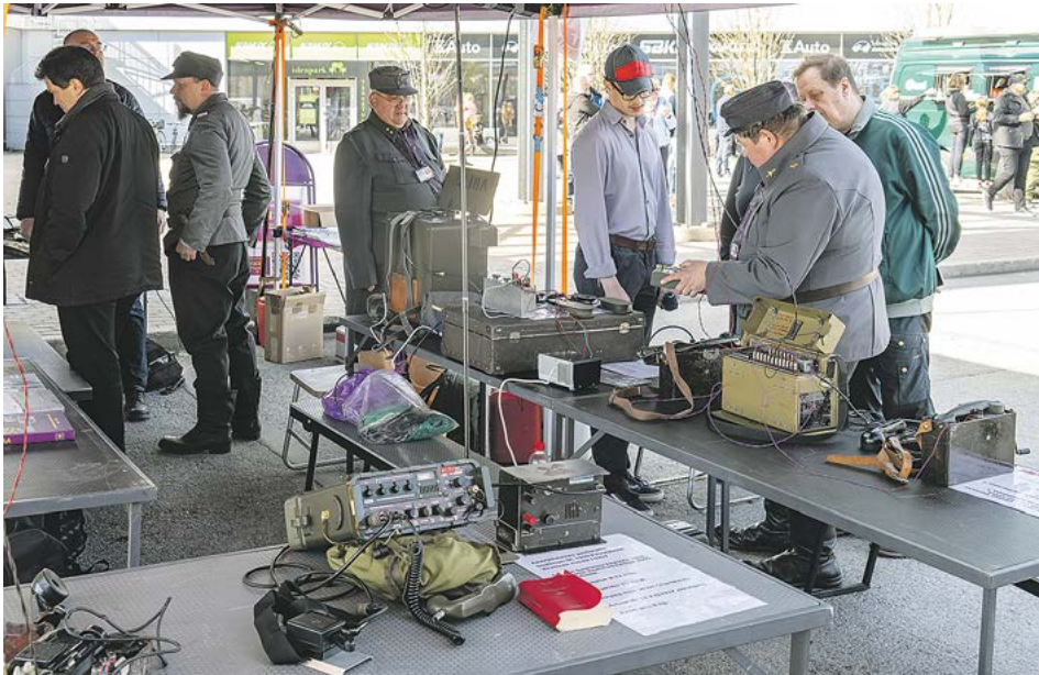
Ulkoalueella Pirkanmaan Viestikillan jäsenet esittelivät viestikalustoa vuosien varrelta.