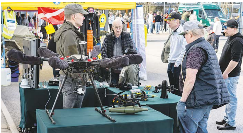
Säres-Centerin esittelypisteellä sai asiantuntevaa tietoa droneista.