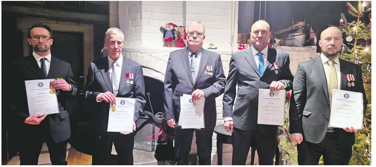
Ryhmäkuvassa Pirkanmaan Reserviupseeripiirin ansiomitalilla palkitut.