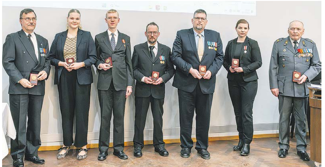
Reserviläispiirin kevätkokouksen alussa palkittiin Reserviläispiirin vuoden 2025 toimijoita.