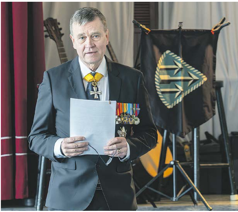
Juhlapuheen piti kenraali Esa Pulkkinen.