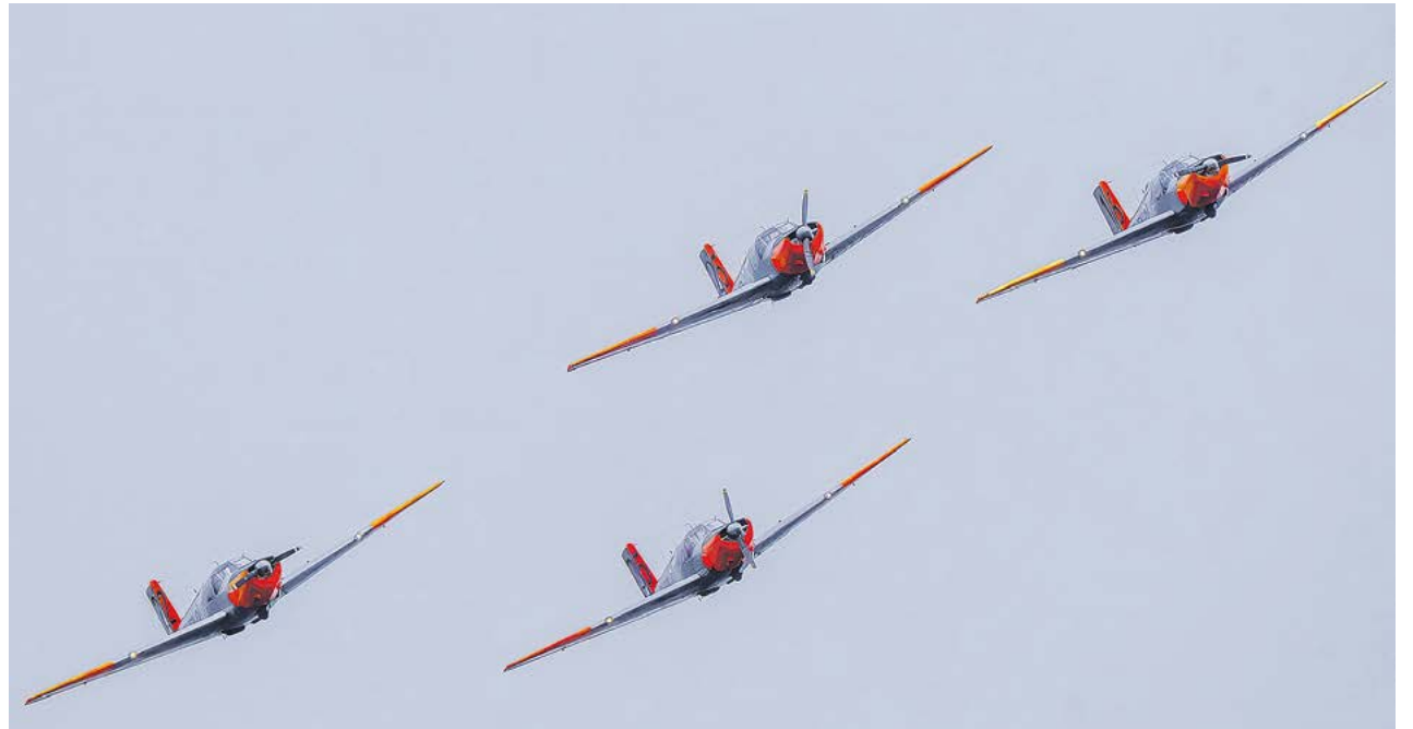
Woikoski Safirs lento-osaston esitys neljällä koneella