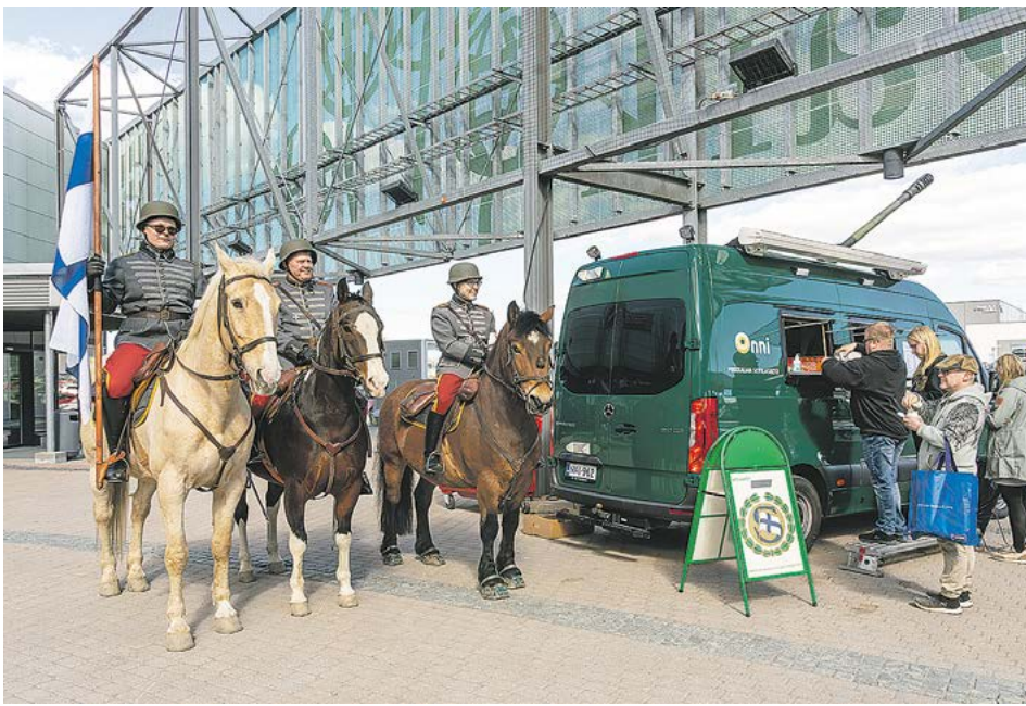
Tampereen Seudun Ratsuväen Killan (Hämeen Eskadroonan) ratsukot esiintyivät ulko-alueella ja hevoset saivat osakseen paljon rapsutuksia. Varmaan myös kiltalaisille maisuivat Tampereen Seudun Sotilaskotiyhdistyksen makoiset munkit, koska ratsukot odottivat vuoroaan sotilaskotiauto Onnin lähetyksillä.