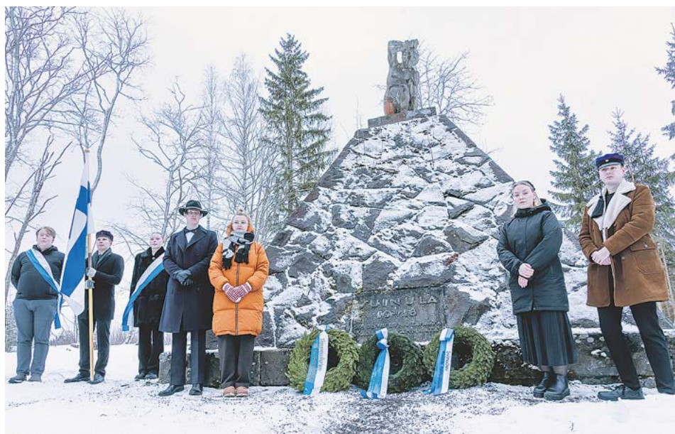
TAMK:N opiskelijajärjestöjen edustajat muistomerkillä.