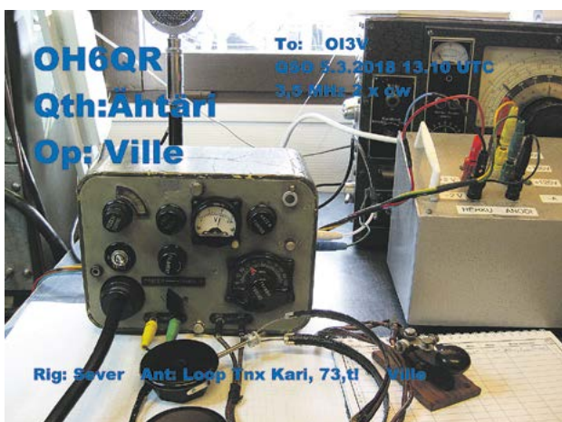
Maailman tunnetuin SEVER-kaukopartioradio.

Kangasalan radiokerho, OH3ABN: Perinnepankki – Tietoja perinneradiois ta: https://oh3abn.net/sivut/perinnepankki Lylyn Viestivarikon radiokerho, OI3V: Kotisivut: https://juupajoen-reservilaiset.reservilaisliitto.fi/oi3v Perinneradiotapahtumien viralliset kotisivut: https://www.putkiradiomuseo.fi/PRT