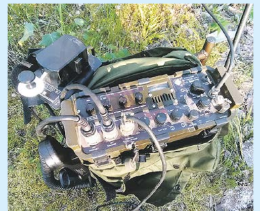
Radioamatöörien peltopäivä- ja perinnekäyttöön sopiva LV 407 radioasema.