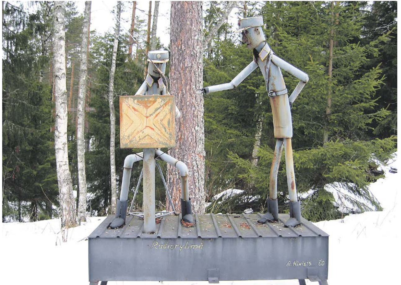
Perinneradiotoiminta on osa suomalaista sotilasradioamatööri ja -harrastetoiminnan historiaa.

Perinneradiotapahtuma ei ole kilpailu, vaan kunnioitus vanhoja yli 40-vuotiaita, veteraaniradioita ja niitä käyttäneitä radioveteraaneja kohtaan. Tapahtumien kohderyhmänä ovat kaikki – etenkin suomalaiset radioamatöörit, joita kiinnostavat vanhat sota-ajan kenttäradiot ja muut sotilasradiot. Kiinnostus on voinut syntyä radioihin liittyvistä tarinoista, oman varusmiesajan kokemuksista ja muistoista tai lyhyt- ja pitkäaaltojen kuuntelusta käyttäen vanhoja putkiaajan radioita. Tapahtuma tarjoaa radioamatööreille mahdollisuuden yhteydenpitoon muihin radioamatööriasemiin kunnostetuilla perinneradioilla, motivoi historiallisen radiokaluston kunnostusta ja edistään sähkötyksen käyttöä radioamatööri liikenteessä. Lisäksi yleisradiolähetyksen DX-kaukokuuntelua harrastavat voivat seurata radioliikennettä 160–10 metrin (1.8–30 MHz) lyhytaalloilla.