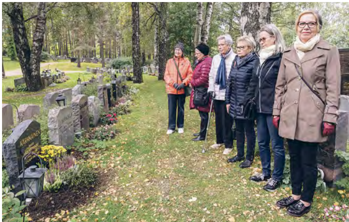
Tampereen Seudun Reserviläisnaiset vierailivat syyskuussa Liisan haudalla Kalevankankaalla ja toivat haudalle keltaisen krysanteemin sekä sytyttivät muistokynttilän.