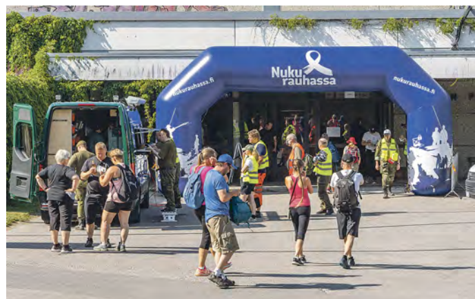
Marssimatkojen alkamista odotellessa sai makean lähdön sotilaskotiauto Onnin tarjoillessa herkkujään.