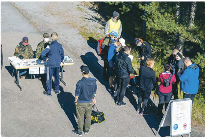
Osallistujien vastaanotto oli tänäkin vuonna ulkona.