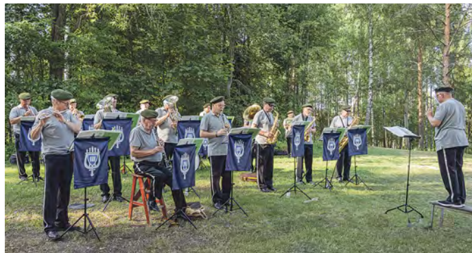
MPK Hämeen soittokunnan esityksistä sai nauttia myös matkojen kääntöpaikalla.