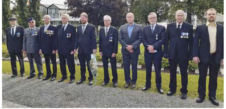
Kerhon jäseniä sankarihautausmaalla.