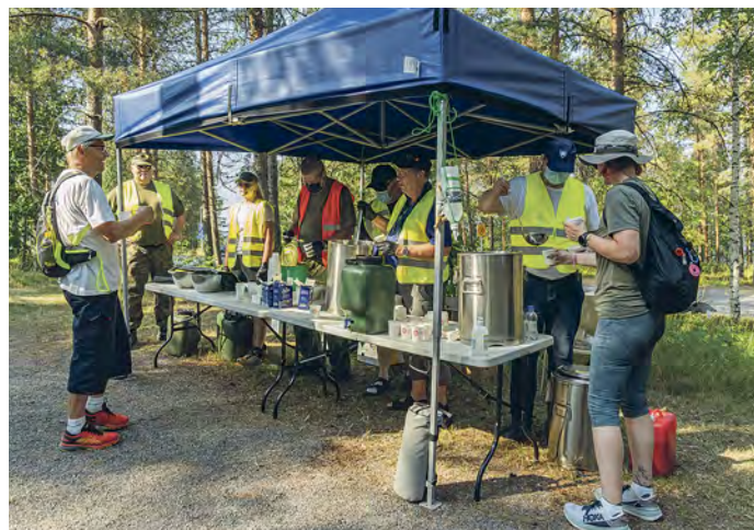
Huoltopisteillä oli tarjolla vettä, mehua, energiajuomaa, banaaneja, suolakurkkuja sekä keksejä.