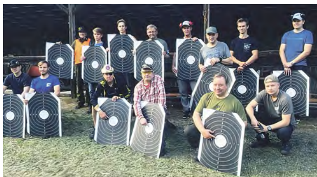
Ammuntojen jälkeen 11.8.2021.