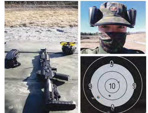
Kilpailussa toiseksi tuli Leena Palovainion kuvakooste.

◀ Voittajaksi selvisi Sami Rantasen ottama kuva.