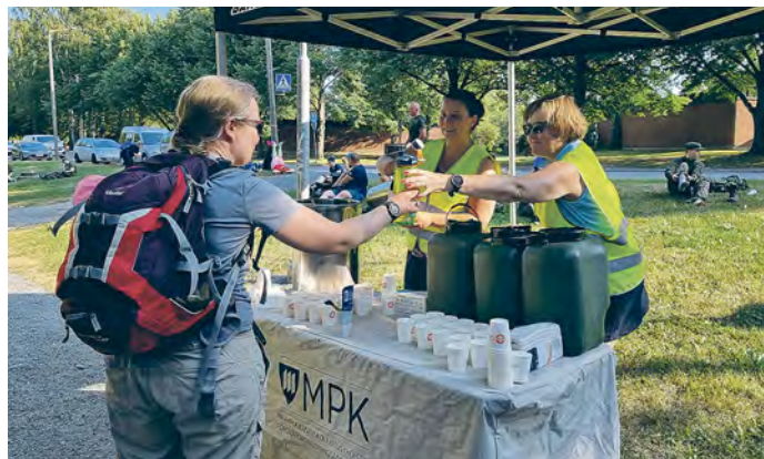
Huoltopiste marssin kääntöpaikalla.